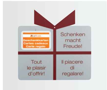
Rotair (Breite 250 mm / Höhe 240 mm)