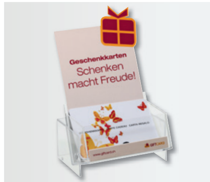
Display MINI (Breite 95 mm / Höhe inkl. Einschubblatt ca. 160 mm)