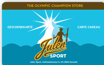
Individuelles Design (Anwendungsbeispiel)