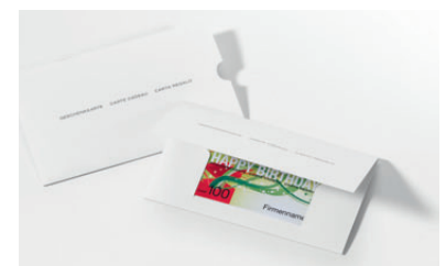
Jede GiftCard mit Geschenkverpackung BASIC

* Preise inkl. 3 Musterkarten als Basis für Ihr «Gut zum Druck».